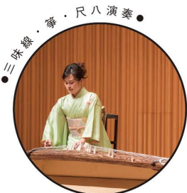
● 三味線・箏・尺八演奏