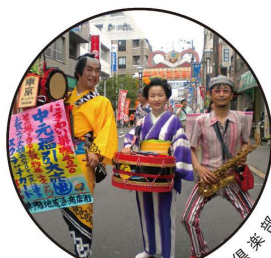
● 東京チンドン屋楽部

※実演スケジュール等の詳細につきましては、ホームページ及び会場内の実演コーナーにてご確認ください。